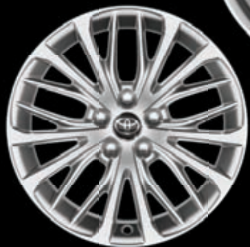
18" диски (20 спиц) Для комплектаций Престиж Плюс, Люкс и Люкс (3,5 л)