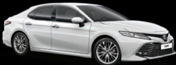
089 Белый жемчуг*