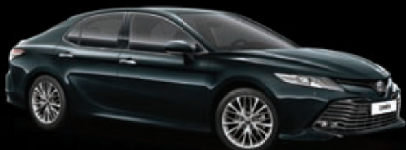
221 Черный изумруд*