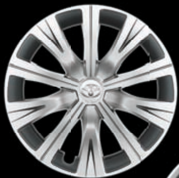
16" диски (10 спиц) Для комплектаций Стандарт, Классик, Классик Плюс, Комфорт и Элеганс