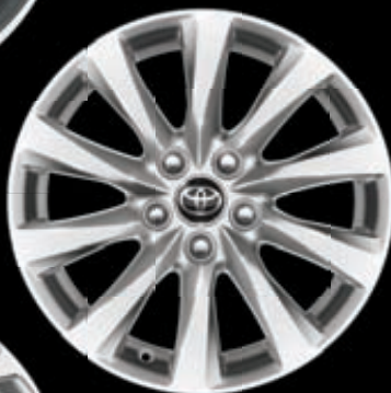
17" диски (10 спиц) Для комплектации Престиж